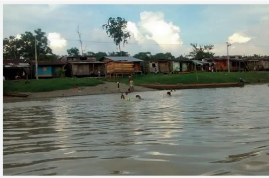
Tiempo de esparcimiento en el río Atrato

La sentencia , además, dice textualmente: “En consecuencia, la Corte ordenará al Gobierno nacional que ejerza la tutoría y representación legal de los derechos del río (a través de la institución que el Presidente de la República designe, que bien podría ser el Ministerio de Ambiente) en conjunto con las comunidades étnicas que habitan en la cuenca del río Atrato en Chocó; de esta forma, el río Atrato y su cuenca -en adelante”.