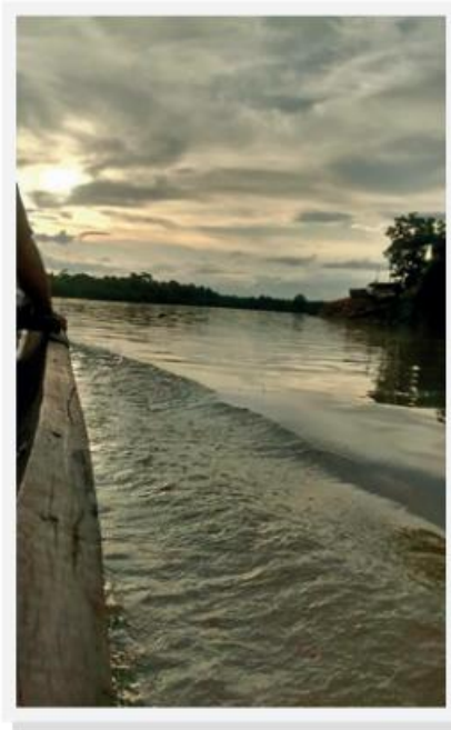
Río Atrato, al atardecer