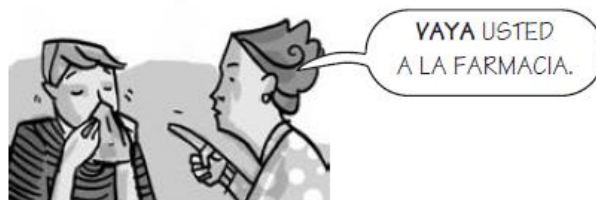
VAYA (verbo ir)