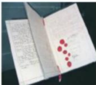
Documento original de la Primera convención de Ginebra.