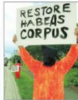
Activista encapuchado y vestido como si fuera un prisionero, protesta para pedir el cierre de la base naval de Guantánamo, en Cuba, donde se encuentran encerrados presuntos terroristas de países como Iraq.

Tanto el Derecho Internacional Humanitario (DIH) como el Derecho Internacional de los Derechos Humanos (DIDH), comparten el objetivo de proteger la vida, la salud y la dignidad de las personas, pero desde puntos de vista distintos. El DIDH dispone acerca de aspectos de la vida en tiempo de paz que no están reglamentados por el DIH, como la libertad de prensa, el derecho a reunirse, a votar y a declararse en huelga, entre otros.