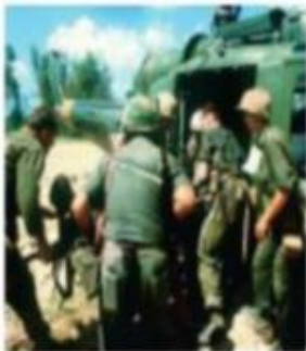
En la guerra de Vietnam, la población civil sufrió múltiples violaciones por parte de los bandos enfrentados.

En la historia reciente abundan graves ejemplos de conflictos donde se presentan violaciones al DIH. No obstante, se ha logrado proteger a la población civil, prisioneros de guerra y heridos, limitando el uso de armas inhumanas.