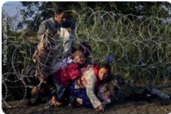
■ Migrantes sirios cruzan debajo de una cerca al entrar en Hungría en la frontera con Serbia, cerca de Röszke, 27 de agosto de 2015.