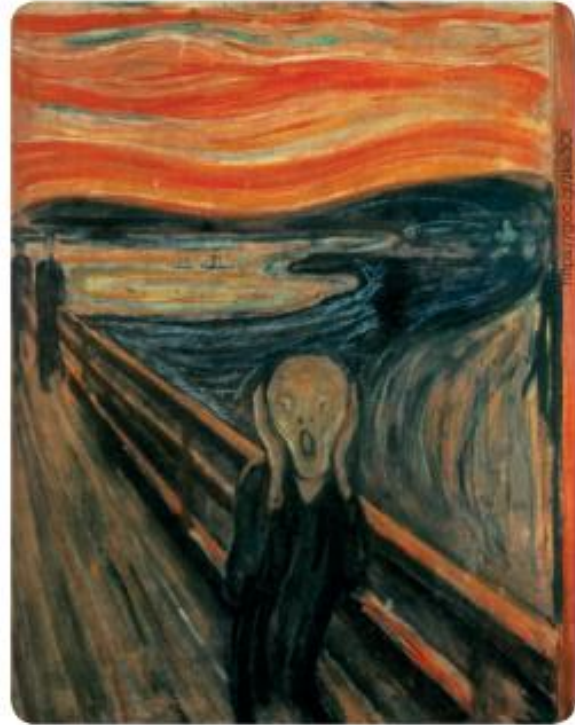
■ El grito. Pintura de Edvard Munch.