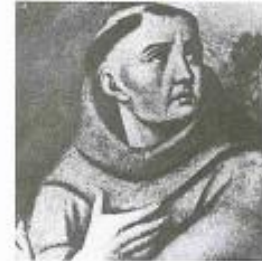
Fray Toribio de Benavente

Creían en mil agüeros y señales, y mayormente tenían gran agüero en el búho, y si le oían graznar o aullar sobre la casa que se asentaba, decían que muy presto había de morir alguno de aquella casa [...]. Tenían también que la mujer que paría dos de un vientre, lo cual en esta tierra acontecía muchas veces, que el padre o la madre de los tales había de morir. El remedio que el cruel demonio les daba era que mataban uno de los mielgos (mellizos), y con esto creían que ni moriría el padre ni la madre, y muchas veces, lo hacían.