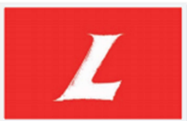
Bandera del Partido Liberal

El descontento de los conservadores frente a estas reformas y la defensa de las mismas por parte de los liberales, llevó a la joven nación a experimentar cinco guerras civiles entre 1850 y 1862, en las cuales resultó victorioso el partido Liberal. Este sería el origen de un periodo denominado Radical en el que bajo sus ideas se fomentó el comercio internacional; se impulsó la educación y se dio la apertura de la frontera agrícola con la colonización antioqueña. Pese al evidente avance en el plano económico, territorial y electoral, en este periodo se excluyeron del poder a los conservadores lo que llevaría nuevamente a dos momentos más de guerra civil y, por ende, a la agudización de las diferencias entre estos dos partidos.