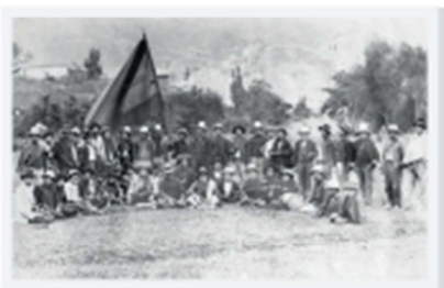
Miembros del ejército conservador preparándose para la Batalla de Palonegro, la más larga y sangrienta de toda la Guerra de los Mil Días. Al final, murieron más de 2.500 soldados, entre liberales y conservadores.

Cómo ya era habitual en Colombia, las diferencias agudizadas entre liberales y conservadores por el control del poder llevarían a que la nación experimentara otra guerra civil. Esta vez sería la más larga de su historia como ya se mencionó anteriormente. Los liberales emprendieron una guerra de guerrillas en contra del Ejército Nacional (que era Conservador y que había sido fundado por Rafael Núñez); esta sería más cruel y despiadada que las anteriores y de la cual saldrían muy mal librados. La superioridad del Ejército Nacional se evidenció especialmente en batallas como la de Peralonso y Palonegro, llevando a casi la extinción de los liberales.