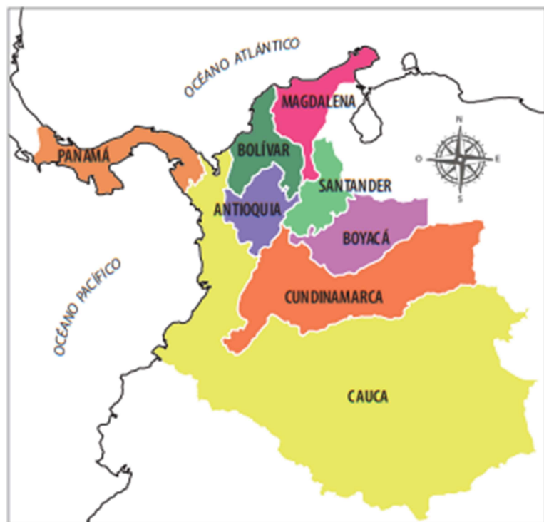
Mapa 3: Nueva Granada, Estados Unidos de Colombia

Fuente: https://es.wikipedia.org/wiki/Organizaci%C3%B3n_territorial_de_los_Estados_Unidos_de_Colombia . Autor: Eliana Díaz