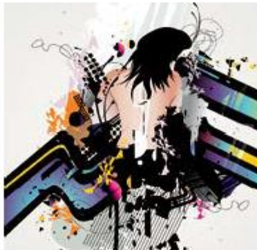
Texturas en ilustración