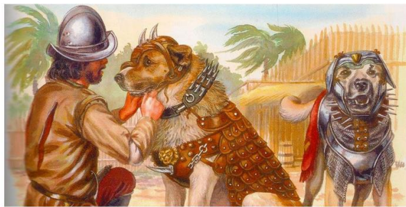
Museo del Conquistador de las Armas, Toluca, México

Cuenta una leyenda de México muy antigua, que hace mucho, mucho tiempo, durante la conquista de América por los españoles, ocurrió algo insólito con unos animales: los perros que usaban para asustar y atacar en los poblados indígenas.