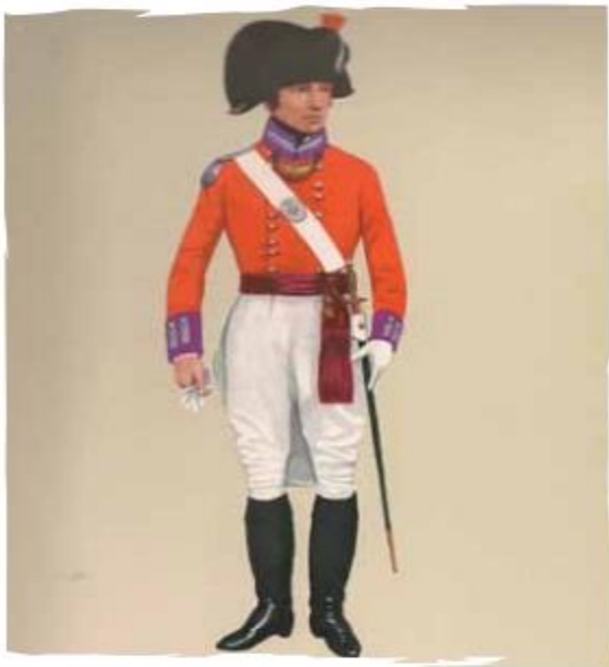
Casacas rojas, el temible ejército inglés.

Francia dio, en un comienzo, ayuda económica a las trece colonias; luego envió tropas para apoyar al ejército rebelde. De esta manera, generales franceses como Laffayet fueron fundamentales en la estrategia militar y el entrenamiento de los colonos. Ten en cuenta que el ejército de las trece colonias estaba compuesto por granjeros, artesanos, comerciantes, tenderos, es decir, por personas sin conocimiento militar, por lo cual la participación francesa en el conflicto, con ejércitos profesionales fue de gran importancia. A pesar que Washington y los demás generales pensaron en realizar una guerra frontal, la debilidad de su ejército los condujo en la mayoría de las ocasiones a la guerra de guerrillas. En el caso de los soldados alemanes, participaron en calidad de mercenarios contratados por la metrópoli inglesa; por su parte, España se limitó a algunas ayudas económicas y a no permitir el ingreso de tropas inglesas a los lugares gobernados por ellos (norte de México). Luego de muchas derrotas y pocas victorias para los colonos, la situación comenzó a cambiar gracias a los sucesos de octubre de 1777 en la zona conocida como Saratoga, al norte del Estado de Nueva York, en donde el ejército inglés luego de fuertes combates y ante el triunfo inminente de los independentistas se rindió; noticia que subió la