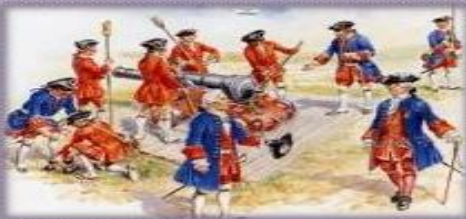
Liberarse del dominio de Inglaterra para alcanzar una autonomía política