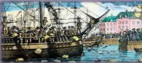
Impulsar el desarrollo del capitalismo en Norteamérica (se prohíbe surgimiento de industrias)