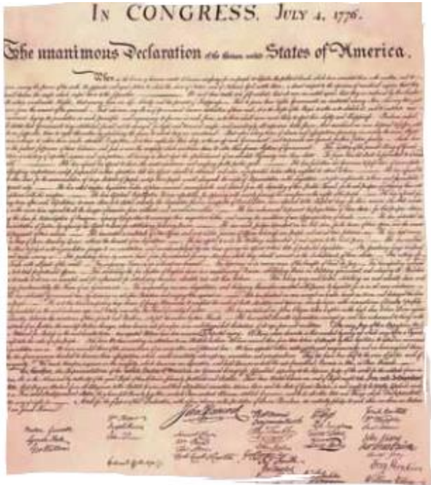
Declaración de independencia de Estados Unidos.

En medio de la guerra, el 4 de julio de 1776, en una reunión de representantes de las trece colonias (56 congresistas) se