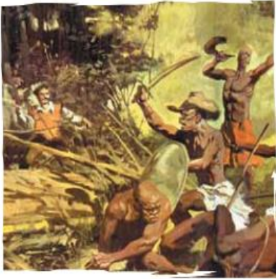
Las castas se clasificaban según sus características físicas o étnicas en: blancos, mestizos, indígenas y negros.

La sociedad colonial estaba dividida en varios grupos llamados castas, definidas según el origen étnico y el papel que desempeñaban en la organización colonial. La casta inferior estaba representada por los esclavos; a quienes le seguían los nativos americanos. A continuación, se ubicaban los mestizos. En la cúspide de la organización social se encontraban los criollos y finalmente los españoles. Entre los españoles y los criollos se repartían los cargos de la administración pública colonial; sin embargo, la preferencia la tenían los peninsulares sobre los criollos para ocupar cargos destacados en la organización política, es decir, el gobierno o en la organización eclesiástica, la Iglesia, que también gozaba de gran poder. Al margen del trato recibido por las castas inferiores de indios, negros y mestizos, la desigualdad de que eran objeto los criollos les provocaba un natural disgusto, pues creían tener el derecho de gobernarse a sí mismos en la tierra que los había visto nacer y a la cual consideraban propia. Por esta razón, demandaban, si no más privilegios que los peninsulares en América, sí un trato en condiciones de