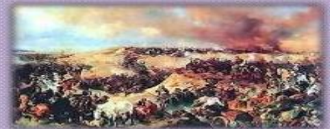
Grave crisis de la economía inglesa ocasionada por su intervención en la guerra de los 7 años.