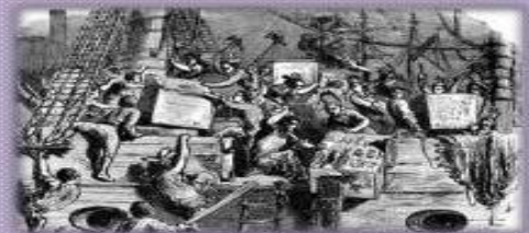
Establecimiento de impuestos lesivos a la burguesía colonial