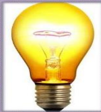
Influencia de la Ilustración: "Los derechos naturales del Hombre"