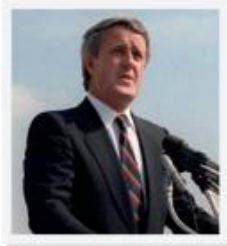
Brian Mulroney (Canadá)

Entre los TLC más representativos establecidos en América Latina se encuentra el Nafta (Tratado Norteamericano de Libre Comercio). Este es un acuerdo regional firmado entre los gobiernos de México, Estados Unidos y Canadá con el propósito de crear una zona de libre comercio 17 . Este tratado entró en vigencia en 1994 y se suscribió durante las administraciones de Carlos Salinas de Gortari en México, George W. Bush en Estados Unidos y Brian Mulroney en Canadá. 5