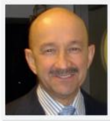
Carlos Salinas de Gortari (México)*