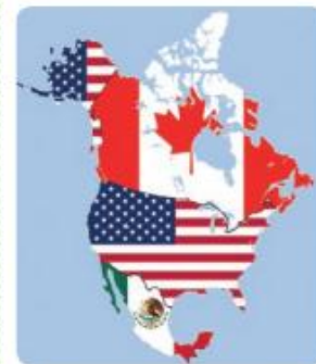
Países y banderas de NAFTA (de arriba hacia abajo): Canadá, Estados Unidos, México

Durante sus primeros años de vigencia (1994-2014), el Nafta trajo para México tanto ventajas como desventajas. Ejemplo de ello ha sido el incremento en las exportaciones de vehículos, sector que tiene un crecimiento anual de 12.6% gracias al incremento de sus plantas automotrices (de 13 a 30). Sin embargo, uno de los sectores que ha tenido mayores perjuicios ha sido la industria de los juguetes. De 380 fabricantes en 1994, solo quedan cerca de 30 para 2014, con un crecimiento anual que no supera el 7%.