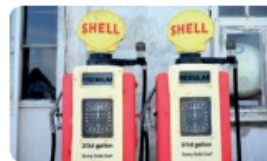
Dice el letrero en una bomba de gasolina: ¡Lo sentimos! ¡No hay!

La crisis del petróleo de 1973 se precipitó cuando los países de la Organización de Países Árabes Exportadores de Petróleo (países de la OPEP más Egipto, Siria y Túnez) decidieron no exportar petróleo a los países que habían apoyado a Israel durante la Guerra de Yom Kippur, que se libraba entre Israel por un lado y Siria y Egipto por el otro.