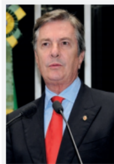
Fernando Collor de Mello*

Brasil, por su parte, siguió el mismo camino de México, ya con gobiernos civiles en el poder. En 1984 el gobierno de José Sarney (1985-1990) acordó algunas medidas liberalizadoras en materia comercial. Sin embargo, la reforma neoliberal cobró impulso durante la administración de Fernando Collor de Mello (1990-1992). Durante su gobierno se aceleró la supresión de los aranceles, se eliminaron prácticamente los permisos a la importación y se inició la privatización de empresas públicas. Años más tarde, durante el gobierno de Fernando Henrique Cardoso (1995-2003) se aceleró el programa de privatizaciones, que abarcaron petróleo, bancos y telecomunicaciones.