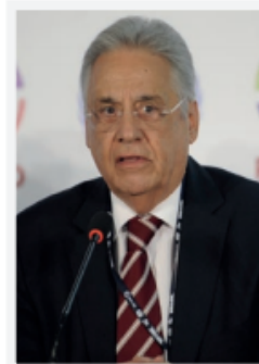
Fernando Henrique Cardoso**

Desafortunadamente, el modelo neoliberal no resolvió los problemas que sus defensores prometían. No se logró un crecimiento elevado y durable, ni se instauró un sistema productivo más articulado, ni hubo progreso social. Por el contrario, el crecimiento económico se tornó débil; los sistemas productivos se orientaron hacia fuera y se desarticulaban, generando desindustrialización, y destrucción de las economías campesinas; también crecieron de manera descontrolada el subempleo, la informalidad, la migración y la pobreza.