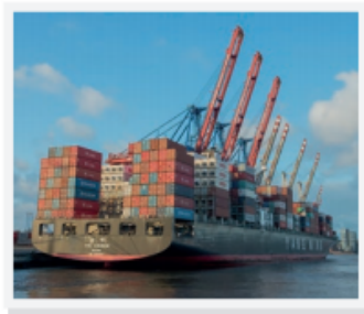
Barco de contenedores para exportación/importación

Durante los años 40 y 50, el modelo ISI experimentó un gran auge, que trajo como consecuencia el incremento del empleo y el surgimiento de nuevas empresas. Sin embargo, la sustitución de importaciones no logró superar el desequilibrio entre los precios de exportación 4 e importación 5 . Tampoco cambió el hecho de que gran parte de los países latinoamericanos siguieron bajo una economía primaria de exportación de materias primas. Esta situación trajo consecuencias negativas como un aumento de la inflación 6 y el incremento de la deuda externa, además de una alta dependencia de la inversión extranjera y la formación de monopolios 7 en diferentes sectores industriales.