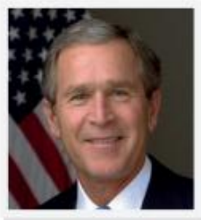
George W. Bush (Estados Unidos)