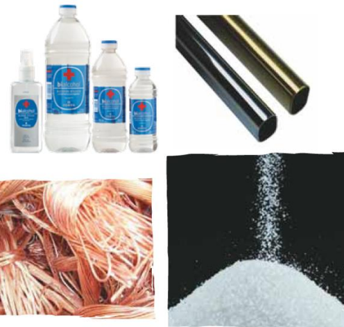
El hierro, el cobre, el oro son elementos químicos; el agua, la sal son compuestos químicos.

Las mezclas heterogéneas son aquellas cuyos componentes se distinguen unos de otros a simple vista. Presentan dos o más estados de agregación, por eso su apariencia no es uniforme y sus componentes se pueden identificar a simple vista. Por ejemplo, la ensalada de frutas, agua con tierra; una roca está constituida por varios materiales.