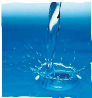
En las mezclas homogéneas no es posible distinguir sus componentes a simple vista.

Molécula: estructura formada por dos o más elementos, que pueden ser del mismo o diferente tipo