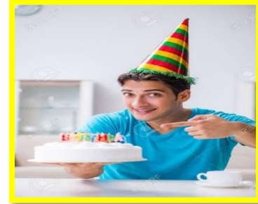
My birthday is on March 4 th .