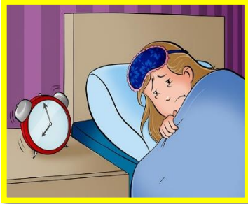
I go to bed at 9:00 p.m.

¿Alguna vez te has puesto a pensar cómo usarías las expresiones que hacen referencia al tiempo en inglés en que realizas tus actividades cotidianas? Para hacerlo es importante conocer las preposiciones de tiempo en inglés.