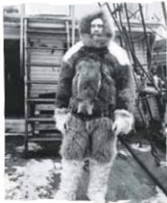
Robert Edwin Peary. Explorador estadounidense que afirmó haber sido la primera persona en llegar el día 6 abril de 1909 al Polo Norte

http://joseluistrujillorodriguez.blogspot.com/2012/11/consecuencias-del-imperialismo.html