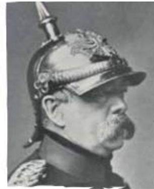
Otto von Bismarck, fundador del Estado alemán moderno. Se le apodó el "Canciller de Hierro" por su mano dura al tratar temas encaminados con su país y determinación.