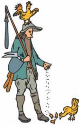
Este hombre, que vivió en Francia en los años previos a la revolución de 1779, pertenecía al tercer Estado. Su condición social lo obligaba a pagar impuestos al gobierno, diezmo a la Iglesia y a trabajar en el campo para beneficio de los terratenientes feudales.

Estaba constituido por los nobles, que formaban la corte del rey: eran sus ayudantes, secretarios, informantes y hasta sus criados. Los demás sectores integrantes del segundo Estado eran la nobleza que vivía en los campos, en los antiguos castillos feudales, y la nobleza llamada “de toga”, que eran algunos funcionarios públicos que no pertenecían a ninguna familia aristocrática, pero que habían logrado vincularse a éstas gracias a sus servicios en el gobierno.