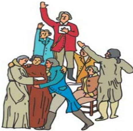
En la Asamblea Nacional Constituyente predominó el Liberalismo

En la Asamblea había varios grupos políticos. En los primeros años de la revolución, se destacan los girondinos, su nombre se debía a que pertenecían al departamento de la Gironda, en el sur de Francia. Ellos eran liberales, pero promovían una política de cambios moderados; por ejemplo, en 1791, cuando Luis XVI quiso huir de Francia y fue detenido por la gente en la población de Varennes, los girondinos no se decidieron a procesarlo ni hacerle daño a pesar del grave delito que significaba abandonar el trono de Francia.