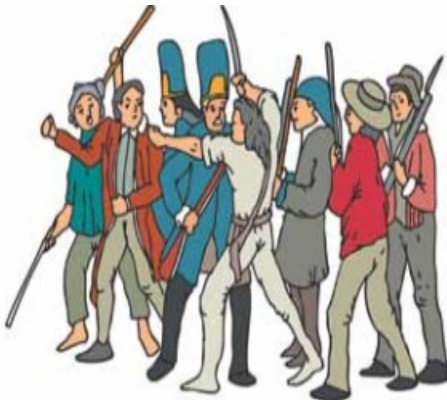
El pueblo francés desbordó sus ánimos en el movimiento revolucionario como respuesta a las condiciones de represiones que vivía