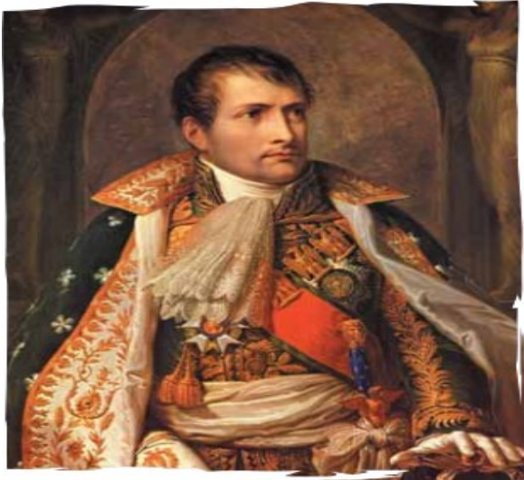
Napoleón Bonaparte, militar francés que gobernó Francia y otros territorios de Europa con el título de emperador.

Napoleón se mantuvo como primer cónsul de Francia de 1799 a 1804; en este último año se convirtió en emperador de Francia y permaneció como tal hasta 1814. Durante esos años dispuso medidas de gran valor para Francia, como el establecimiento y aplicación de un código civil, un acuerdo con la Iglesia y la creación de un Banco Nacional, imprescindible para la consolidación del nuevo gobierno que dirigió.