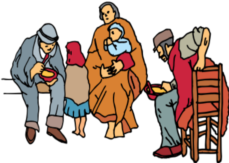
Aspectos de la pobreza de las familias obreras en las ciudades del siglo XIX, en Inglaterra.

Así mismo, las ciudades iban creciendo o los viejos pueblos se convertían en ciudades. De esta forma, poblaciones de cinco mil habitantes se vieron multiplicados por 10 en un lapso de 30 o 40 años. Este aumento se debía no solo a la expulsión de los campesinos de sus tierras, sino también a la explosión demográfica. Como era de esperarse muchos de estos pueblos no estaban listos para la transformación, pues carecían de alcantarillado, de agua potable y de vías en buen estado. Por esto, se presentaron serios problemas de salubridad y hacinamiento con casas amontonadas en donde sobraban las enfermedades y la basura.