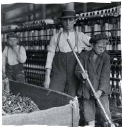
Aspecto interno de una fábrica hilandería en el siglo XIX.

El otro lugar que sufrió transformaciones fue el campo. En Inglaterra, los grandes terratenientes habían arrendado sus tierras a los campesinos e incluso algunos habían vendido parte de ellas dando paso a la aparición de pequeños propietarios. Esto no significó que los grandes terratenientes desaparecieran, sino que habían considerado que era más rentable arrendar sus tierras, comprar los productos a los arrendatarios a bajo precio y luego venderlos en las ciudades. Pero cuando aumentó la demanda de paños para la exportación, los grandes terratenientes descubren un negocio que dará más ganancias: la ganadería lanar.