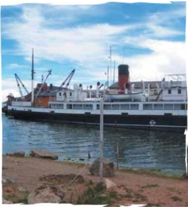
La revolución en las comunicaciones se comenzó a vivir con la aparición del barco a vapor.

Sin embargo, las nuevas obras no fueron suficientes para poder sacar el alto volumen de mercancías, pues el tránsito por los caminos era lento y en la época de invierno se hacían casi intransitables. Se debió pensar entonces en una nueva vía de comunicación que fuera más rápida y económica y entonces Inglaterra se vio llena de canales marítimos por donde antes se veían estrechos ríos. Con la comunicación fluvial se redujo el tiempo de viaje y se aumentó la capacidad de carga.