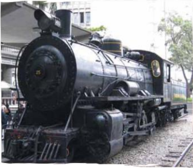
La locomotora, significó un gran cambio en el desarrollo del transporte masivo.

Con la fabricación del acero surgieron los rieles metálicos que dieron paso, en principio, a pequeños trenes de tracción animal, utilizados para el transporte de mercancías en trayectos relativamente cortos. Es de recordar que el sistema de rieles se venía utilizando desde siglos atrás en el trabajo de las minas, pero hechos era de madera, lo que hacía corta su durabilidad. Con los rieles metálicos la movilidad no sólo fue mejor sino más segura y perdurable.