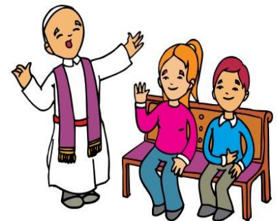
La religión es parte fundamental para la espiritualidad de los seres humanos.

Los judíos fueron invadidos por poderosos imperios: primero por los asirios y luego por los babilonios. Estos imperios los sometieron exigiéndoles tributos. Muchos judíos fueron esclavizados y otros más fueron deportados a tierras lejanas.