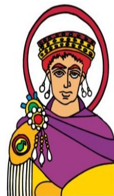
El derecho romano fue recopilado por encargo de Justiniano.

El derecho romano no fue siempre el mismo. Sus constantes cambios obedecieron a las transformaciones de su propia sociedad. Por ejemplo, al desarrollarse más las relaciones comerciales romanas, creció el número de leyes relativas al intercambio de productos y servicios. Dichos cambios en las leyes fueron realizados por los funcionarios encargados de impartir justicia: los jueces.