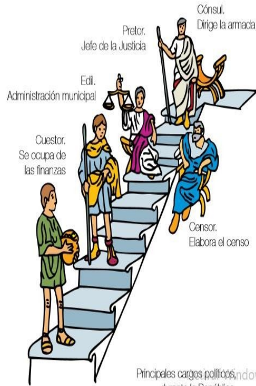
Principales cargos políticos durante la República

Roma vivió un periodo de guerra civil entre los años 90 y 80 a.C. que duró aproximadamente 50 años. Durante este tiempo se presentaron constantes enfrentamientos entre los populares y los optimates que se caracterizaban por ser las dos tendencias políticas del momento. Entre los años 74 y 71 a.C. un esclavo llamado Espartaco lideró varias sublevaciones que vencieron las tropas del ejército romano. Este fue derrotado por los militares Craso y Pompeyo, quienes fueron nombrados