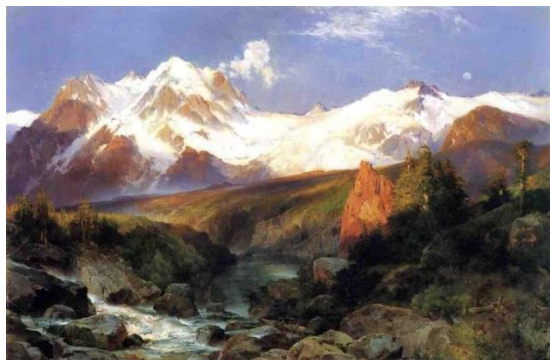
La gama de Tetón, Tomas Moran, óleo sobre lienzo 1897

Observa el cuadro y describe la sensación que te produce. ¿Sabes cómo se relacionaron los poetas románticos con la naturaleza y sus paisajes?